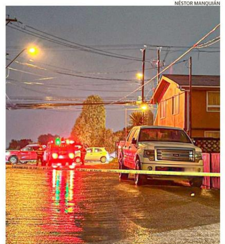
LA CAMIONETA INCAUTADA A LA MUJER IMPUTADA.

La conductora pasará hoy a control de detención en el Juzgado de Garantía de Puerto Montt, por instrucciones de la Fiscalía Local. En la instancia judicial, eventualmente, sería formalizada por cuasi delito de homicidio.