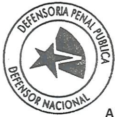
ANDRÉS MAHNKE MALSCHAFSKY DEFENSOR NACIONAL