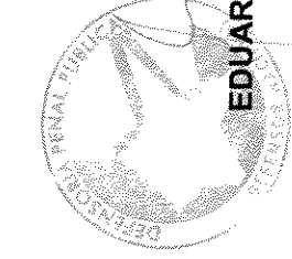
EDUARDO SEPÚLVEDA CRERAR Defensor Nacional

La personería de don Eduardo Sepúlveda Crerar para representar a la Defensoría Penal Pública, consta en Decreto N° 512 del Ministerio de Justicia de fecha 7 de abril de 2006, documento que no se inserta por declarar las partes conocer y aceptar íntegramente su texto.