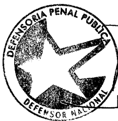
RODRIGO QUINTANA MELENDEZ DEFENSOR NACIONAL

Sin otro particular, saluda atentamente a usted,