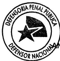
ANDRÉS MAHNKE MALSCHAFSKY DEFENSOR NACIONAL DEFENSORÍA PENAL PÚBLICA